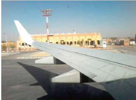
L'aéroport, a précisé M. Tiar. Bien que le projet ait été retardé en raison de "plusieurs facteurs", une reprise

Le projet comprend l'extension de la piste et la construction de nouvelles installations aéroportuaires, en plus de la construction d'une voie de contournement de la route nationale n 45 qui dessert