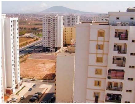
bués à leurs bénéficiaires à l'occasion de la célébration du 70ème anniversaire de la Glorieuse guerre de libération nationale.

Par ailleurs, pas moins de 3.000 logements, tous programmes et formules confondues (LPL, location-vente et habitat rural), seront distri-