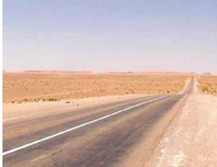
(communément appelée route des poids-lourds), à Sedrata, sur 9 km. M. Medahi a aussi fait savoir que l'entretien du CW 8 entre les villes de Dréa (Souk

Des travaux d'entretien ont également été entamés sur la RN 81, entre les villes de Ragouba et de Sedrata, sur une distance de 11 km, ainsi que sur la RN 81 H