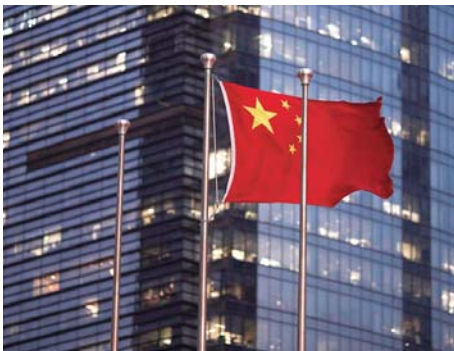
face à la faiblesse des prix et à un risque déflationniste. Le BNS a par ailleurs fait état dimanche d'une baisse de 2,8%

Alors que de nombreuses grandes économies occidentales sont confrontées à la menace d'une inflation élevée, la Chine fait au contraire