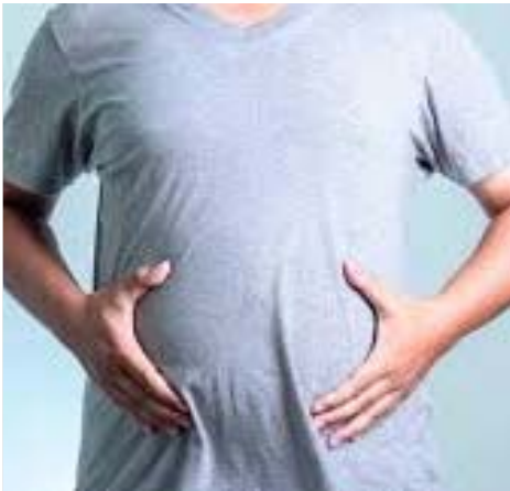
des ballonnements. Le petit plus : il est riche en probiotiques qui facilitent la digestion et évitent les complications intestinales.

Pour se sentir léger, il existe de nombreux aliments qui vous procureront une sensation de confort.