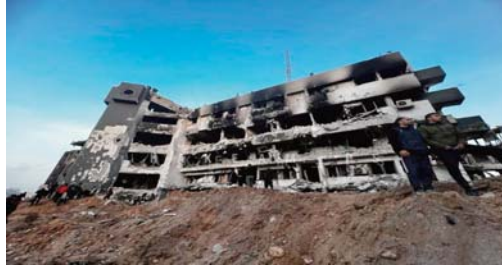
Forces d'occupation sionistes contre les Palestiniens à Ghaza. En outre, à al-Khair, une autre maternité de Khan Younés, «il ne semblait pas y avoir le moindre équipement médical en état de

sant aux journalistes à Genève par liaison vidéo depuis Al-Qods occupée, M. Allen a décrit avoir vu «du matériel médical volontairement brisé, des échographes - qui, vous le savez, sont un outil très important pour garantir des accouchements sûrs - avec des câbles coupés». «Des écrans d'équipements médicaux sophistiqués, comme des échographes et autres matériels, ont été brisés», a-t-il ajouté. L'Organisation mondiale de la santé (OMS) avait décrit la difficulté d'introduire de tels équipements à Ghaza avant même les agressions actuelles menées depuis le 7 octobre dernier, par les