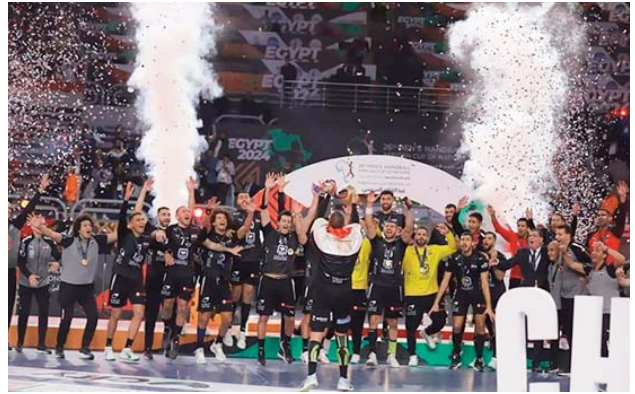
Tunisie, le Cap Vert et la Guinée.

Cette 26e édition du CAN a également enregistré la qualification des cinq premiers au classement au Championnat du monde 2025 prévu en Croatie, Danemark et Norvège. Il s'agit de l'Égypte, l'Algérie, la