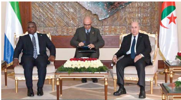
arrivé mardi soir à Alger. Il a été accueilli, à son arrivée à l'aéroport international Houari-Boumediene, par le Premier ministre, M. Nadir Larbaoui.

Les deux Présidents ont passé en revue des détachements des différentes forces de l'Armée nationale populaire qui leur ont rendu les honneurs avant d'écouter les hymnes nationaux des deux pays. Le président de la République du Sierra Léone est