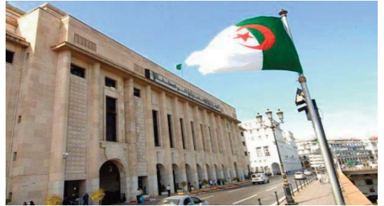
des communes de Draâ El Mizan et Boghni, et du complexe textile industriel (Cotitex) de Draâ Ben Khedda, filiale de l'entreprise algérienne des textiles industriels et techniques (EATIT).

Au programme de la deuxième journée des parlementaires à Tizi-Ouzou, figurent la visite de la zone d'activité de Larbaâ Nath Irathen, en chantier, des zones d'activités