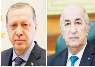
Le président de la République a affirmé que "l'Algérie se tiendra aux côtés de la Turquie pour surmonter cette épreuve qui a endeuillé

"Le Président de la République, M. Abdelmadjid Tebboune a eu mardi un entretien téléphonique avec son frère, le Président de la République turque, M. Recep Tayyip Erdogan, au cours duquel il lui a réitéré, en son nom personnel et au nom du peuple algérien, ses sincères condoléances pour les victimes du séisme dévastateur qui a frappé une grande partie du Sud-Est de la Turquie", précise le communiqué.