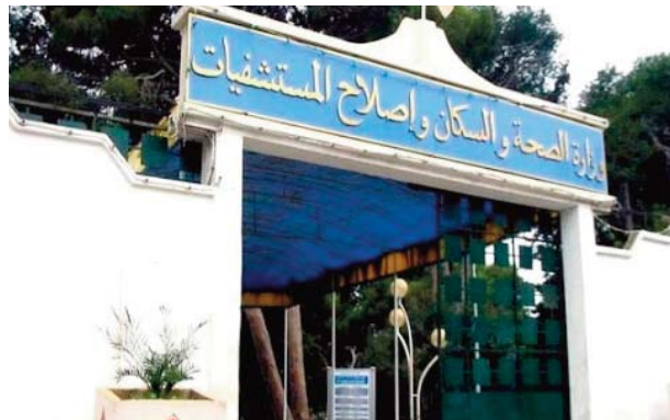
et respect des règles d'hygiène et de l'obligation du respect du confinement physique, rappelant l'obligation du respect du confinement et du port du masque.

Le même responsable a souligné que la situation épidémiologique actuelle exige de tout citoyen vigilance