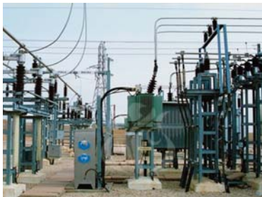
document. Les services techniques de la direction ont entamé dernièrement des travaux d'entretien des réseaux de distribution dans plusieurs communes, note-t-on.

Cette direction dispose d'un système technique intégré qui permet de repérer et contrôler à distance le réseau électrique de moyenne tension long de 6,500 km et assurer la détection des pannes en temps réel avec précision, selon le