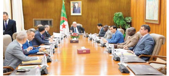
Les amendements remplissant les conditions légales ont été soumis aux commissions compétentes en

A noter que le bureau de l'APN avait entamé les travaux de sa réunion par l'examen des amendements proposés aux trois textes de lois débattus la semaine dernière. Il s'agit du projet de loi relatif à la presse écrite et à la presse électronique, du projet de loi sur l'activité audiovisuelle et de la proposition de loi organique modifiant et complétant la loi 18-15 relative aux lois de finances.